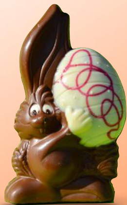
Lapin Carotin - 150g Chocolat au lait Décoré main - H 19 cm