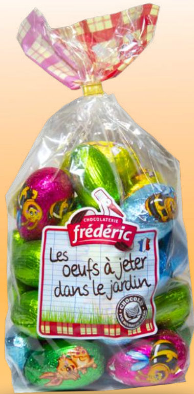
Oeufs à jeter dans le jardin - 480g Oeufs creux chocolat au lait Hauteur oeuf : 6 cm