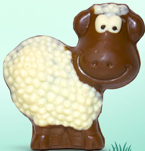
Léo le Mouton - 150g