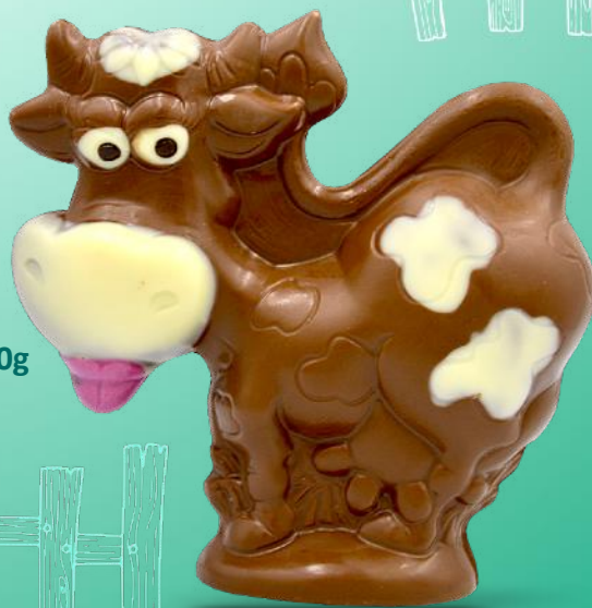
Monica la Vache - 150g Chocolat au Lait Décoré main - H 13 cm 5,84 € la pièce Soit 38,91 €/kg