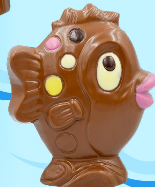
NOUVEAU Bubulle - 300g Chocolat au lait Décoré main - H 32 cm Ref. R118 11,35 € Soit 37,86 €/kg