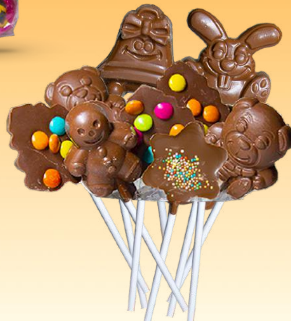
Sachet 9 Sucettes - 180g Chocolat au Lait Décoré main Ref. R126 7,44 € Soit 41,31 €/kg