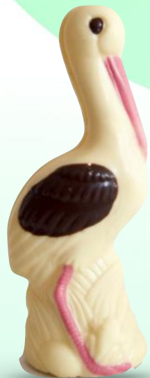
Zouki la Cigogne - 90g Moulage chocolat blanc Décoré main - H 17 cm Ref. R112 3,50 € Soit 38,91 €/kg