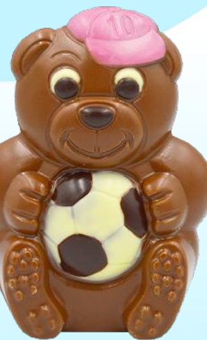
NOUVEAU Max l'ours - 125g Chocolat au lait Décoré main - H 13 cm Ref. R116 4,86 € Soit 38,91 €/kg