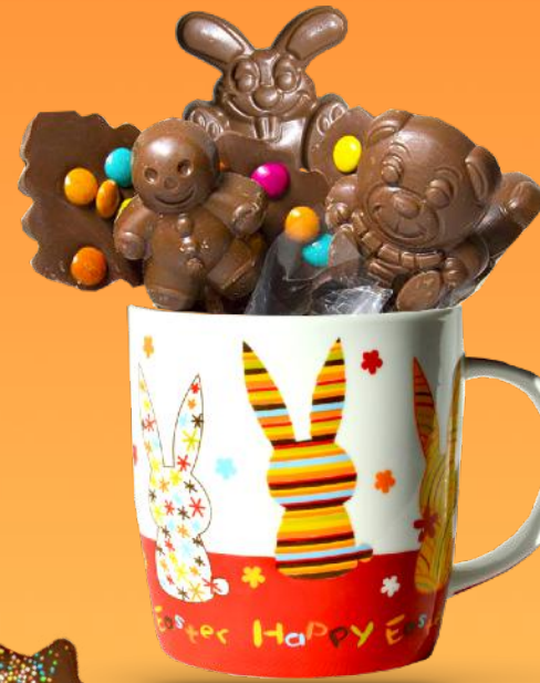
Mug Sucettes - 180g 9 sucettes au chocolat au lait Décorées main Motifs et couleur du Mug variables